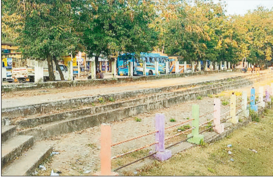
मार्ग किनारे दुकानों का निर्माण हो सकता है

शहर के प्रतीक्षा बस स्टैंड के बगल में स्थित प्राचीन तालाब के सौंदर्यीकरण के लिए पूर्व में लाखों रूपए खर्च कर, घाट निर्माण, फुटपाथ निर्माण के साथ दर्जनों की संख्या में डेकोरेटिव लाइट लागाई गई थी, तब ऐसा लग रहा