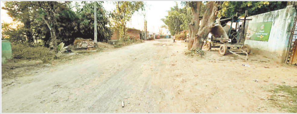
एनएच को जोड़ने वाली जर्जर सड़क।