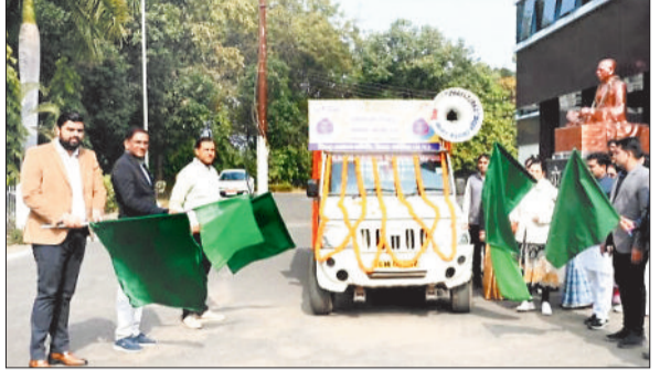
जागरूकता रथ को हरीझंडी दिखाकर रवाना करती कलेक्टर।

शहर के प्रतीक्षा बस स्टैंड के समीप स्थित प्राचीन तालाब के सौंदर्यीकरण के लिए भले ही खर्च कर दिया गया हो, लेकिन हकीकत यह है शाम ढलते ही यह क्षेत्र अंधेरे में डूब जाता है, इसके अलावा प्राचीन तालाब की साफ-सफाई नहीं होने के कारण तालाब में गंदगी पसरी हुई है। तालाबों को संरक्षित करने की दिशा में सररोवर धरोहर योजना केवल कागजों में ही संचालित हो रही है।