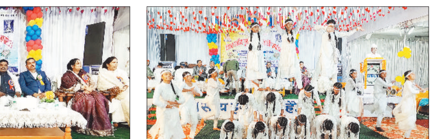
कार्यक्रम की प्रस्तुति देते प्रतिभागी।

चरचा कॉलरी। जिले के सतनामी समाज द्वारा जिला स्तरीय गुरु घासीदास जयंती समारोह का आयोजन 18 दिसंबर को नगर पालिका शिवपुर चरचा स्थित सुभाषनगर गुरुघासीदास भवन में श्रद्धा एवं उल्लास के साथ किया गया। यह आयोजन संत शिरोमणि, मानवता के प्रणेता गुरुघासीदास जी की 269 वीं जयंती के पावन अवसर पर संपन्न हुआ। कार्यक्रम का आयोजन प्रगतिशील सतनामी समाज के तत्वावधान में किया गया। जयंती