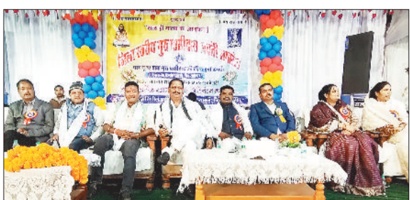
मंच पर उपस्थित अतिथि।

चरचा कॉलरी। जिले के सतनामी समाज द्वारा जिला स्तरीय गुरु घासीदास जयंती समारोह का आयोजन 18 दिसंबर को नगर पालिका शिवपुर चरचा स्थित सुभाषनगर गुरुघासीदास भवन में श्रद्धा एवं उल्लास के साथ किया गया। यह आयोजन संत शिरोमणि, मानवता के प्रणेता गुरुघासीदास जी की 269 वीं जयंती के पावन अवसर पर संपन्न हुआ। कार्यक्रम का आयोजन प्रगतिशील सतनामी समाज के तत्वावधान में किया गया। जयंती