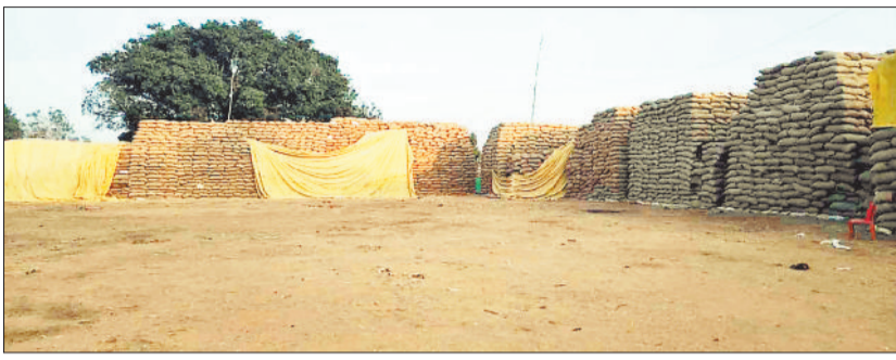
समिति में जाम धान।

धान की कटाई-मिसाई पूरी होने के बाद अब किसान जल्द से जल्द अपनी उपज बेचने की कोशिशें कर रहे हैं। बड़ी संख्या में किसान हर दिन अपनी उपज बेचने उपार्जन केंद्रों में पहुंच रहे हैं। इस बार पंजीकृत किसानों की संख्या में वृद्धि हुई है इसके बावजूद दो हजार से अधिक किसानों का अब तक पंजीकरण नहीं हो पाया है। धान खरीदी में भी तेजी आई है लेकिन पिछले