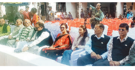
हरिभूमि न्यूज. मनेन्द्रगढ़

शहर के मध्य स्थित सरस्वती विकास विद्यालय में सत्र 2025-26 के वार्षिकोत्सव का आज अत्यंत गरिमामय, अनुशासित एवं भव्य शुभारंभ हुआ। पूरे विद्यालय परिसर को आकर्षक सजावट, रंग-बिरंगे गुब्बारों एवं सांस्कृतिक प्रतियों से सजाया गया था, इससे कार्यक्रम का वातावरण उल्लासपूर्ण और प्रेरणादायी बन गया।